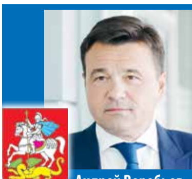
Андрей Воробьев, Губернатор Московской области

– У жителей есть большой запрос на ремонт дорог. Все перепады, сложный климат приводит к тому, что весной особые усилия мы должны направить на приведение в порядок дорожно-транспортной сети и тротуаров, которые являются незаменимыми, важными в жизни каждого человека.