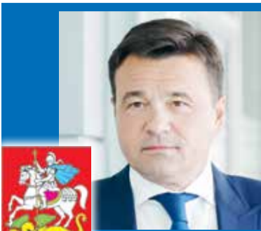
Андрей Воробьев, Губернатор Московской области

– Нет сомнений, что будущее за «цифрой». У нас в Подмосковье 12 региональных и 60 муниципальных архивов. Там хранится большой объем информации. Оцифровка сделает ее открытой и общедоступной. Это особенно важно, когда исторические факты искажаются в угоду чьим-то интересам. Поэтому мы поддерживаем проект Минэкономразвития о цифровом архиве и планируем продолжать модернизацию на муниципальном уровне.