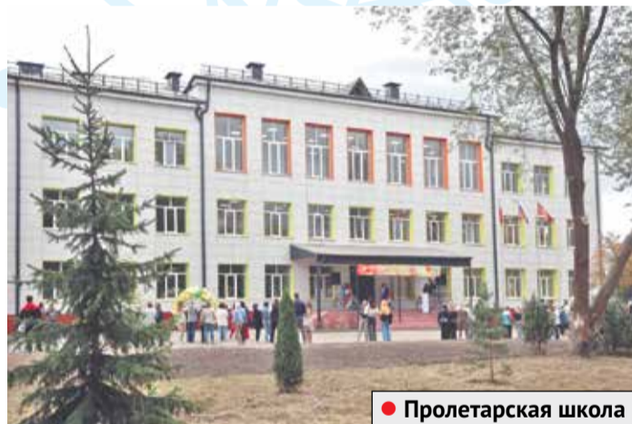
● Пролетарская школа

вестиционных проектов. Под конец уходящего года в Серпухове после длительного перерыва вновь начал работу лифтостроительный завод. Новые лифты прежде всего пойдут в МКД на замену устаревших конструкций.