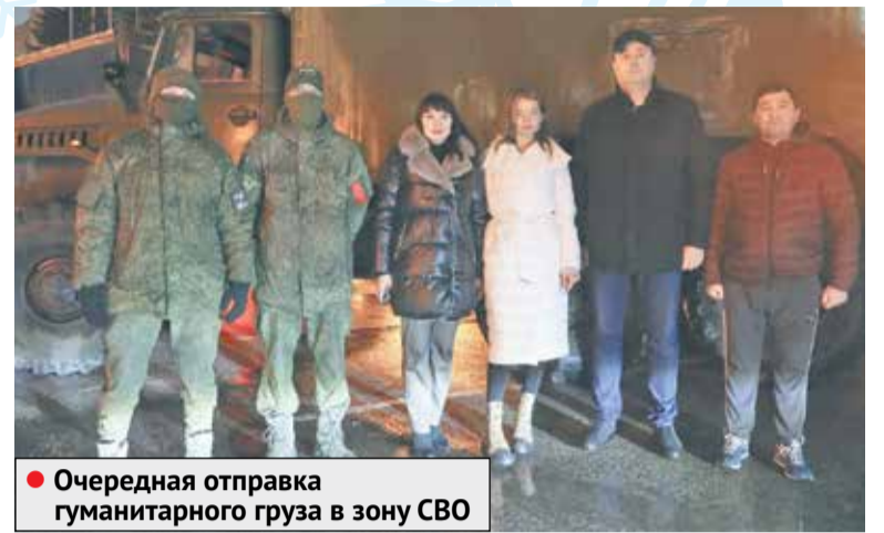
● Очередная отправка гуманитарного груза в зону СВО

Каким был этот непростой год для Серпухова? Что удалось реализовать из задуманного? Какие проекты стали в этот период приоритетными? На что было акцентировано внимание власти и жителей?