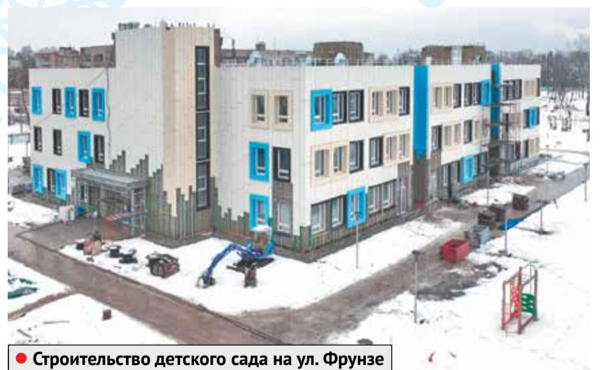
● Строительство детского сада на ул. Фрунзе