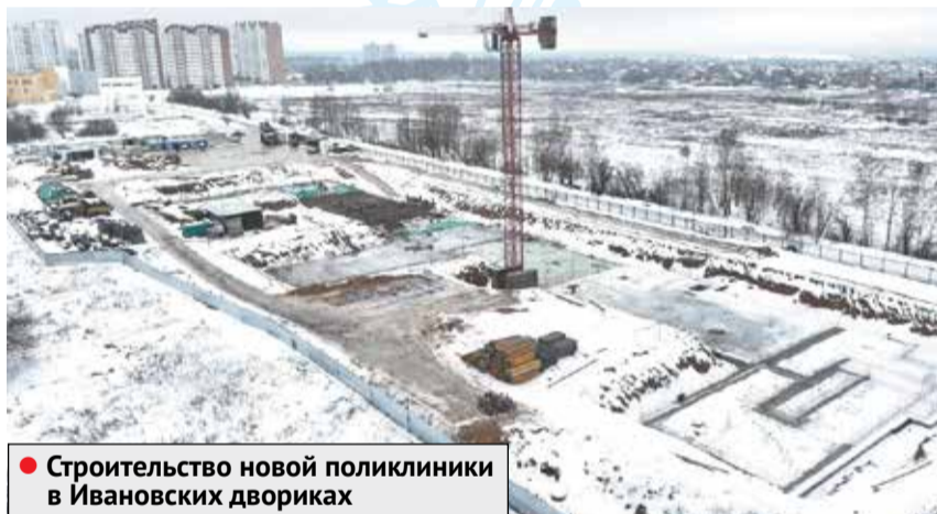
● Строительство новой поликлиники в Ивановских дворах

Мы входим в 2023 год с большими и позитивными надеждами. Надеждами на прочный мир, улучшение качества жизни и благополучие.