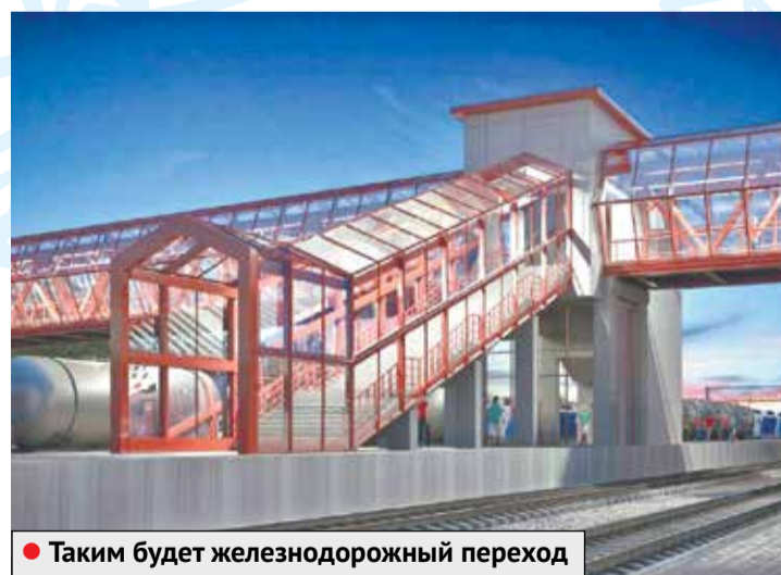
● Таким будет железнодорожный переход