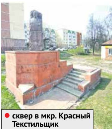
● сквер в мкр. Красный Текстильщик

Отдать свой голос можно только за один объект. При желании подержите предложения других пользователей.