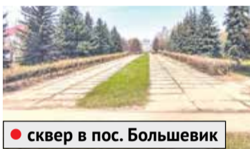
● сквер в пос. Большевик

До 1 мая на «Доброделе» проходит сбор предложений по установке дополнительного наружного освещения и архитектурно-художественной подсветки. Жители решают, на каких улицах, площадях, скверах Московской области станет светлее! Все предложения рассмотрят, когда будут утверждать адресный перечень проекта «Светлый город» на 2024-2027 годы.