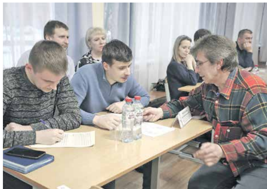
График проведения «Выездных администраций»

Встречи в таком формате будут продолжаться регулярно во всех населенных пунктах округа. Это необходимо прежде всего для того, чтобы каждый житель почувствовал позитивные перемены.