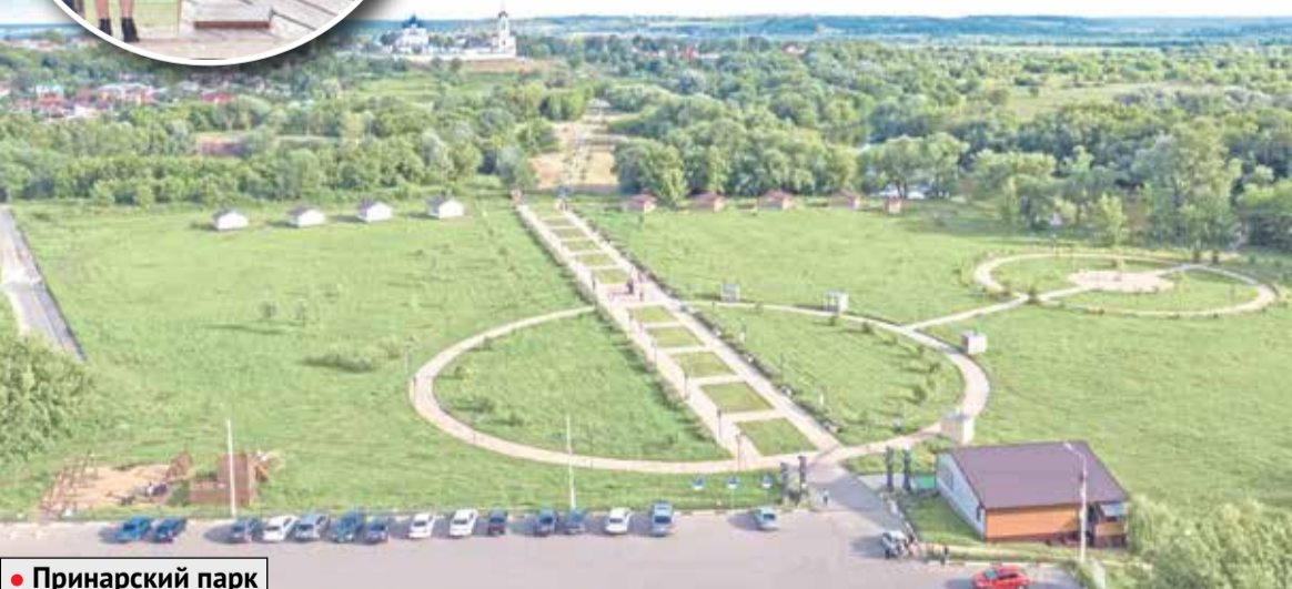
• Принарский парк