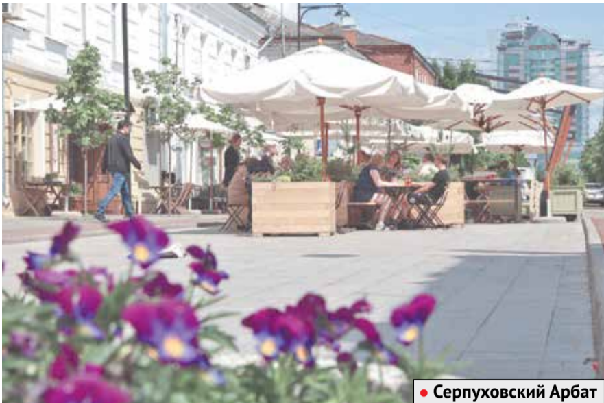
• Серпуховский Арбат