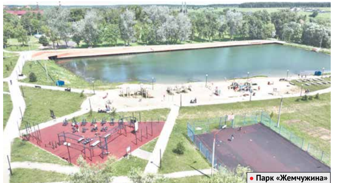
• Парк «Жемчужина»