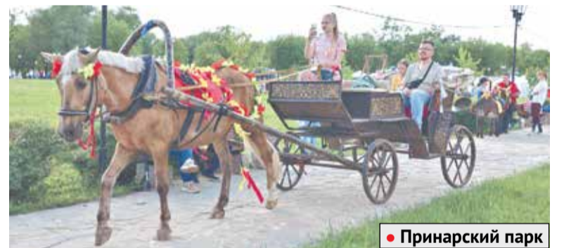
• Принарский парк

Отличное место для отдыха – парк «Жемчужина». К началу летнего сезона здесь заменили испорченные конструкции пирса, а МБУ «Комбинат благоустройства» выполнил отсыпку береговой зоны песком, провел покос травы, установил дополнительные урны.