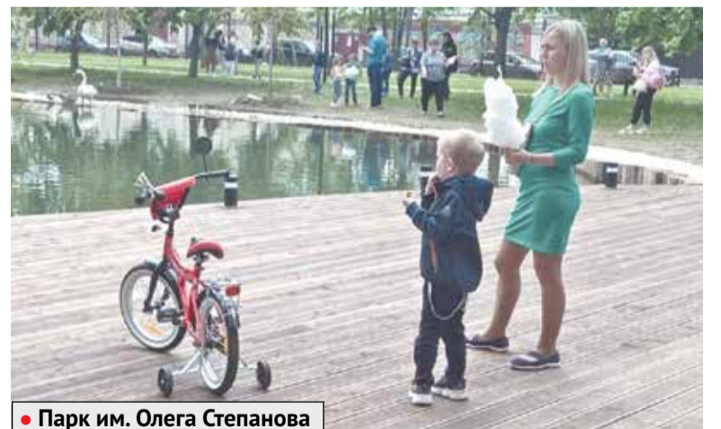
• Парк им. Олега Степанова