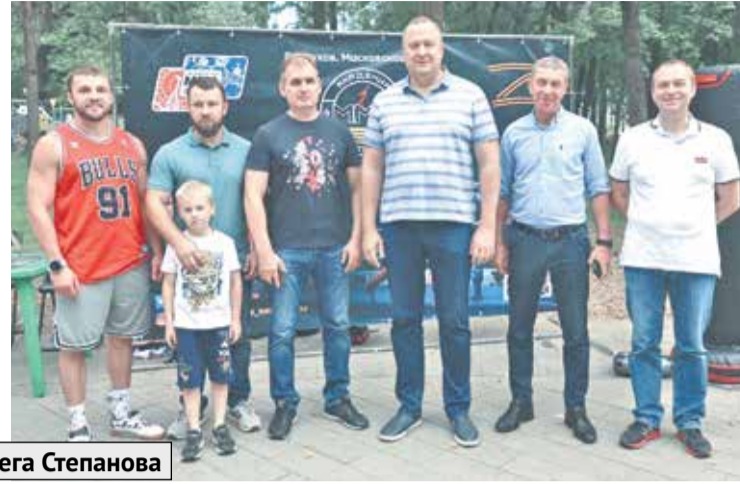
● Парк им. Олега Степанова