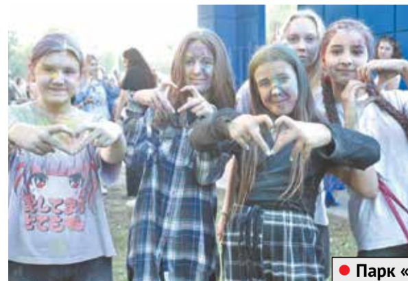
● Парк «Питомник»

– Обожаю фитнес, а разминки на свежем воздухе – вообще супер! Не могла пропустить праздник в парке имени Олега Степанова, а потом и в «Питомнике». В Серпухове сейчас так много мест для занятий спортом: площадки, парковые зоны, стадионы... Скоро начнет полноценно работать любимый наш «Спартак». Слышала, что после реконструкции этот стадион в бору будет на высочайшем уровне. Друзья, любите спорт – и будете всегда здоровы и жизнерадостны!