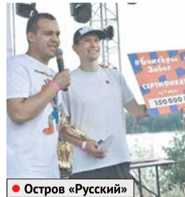
● Остров «Русский»