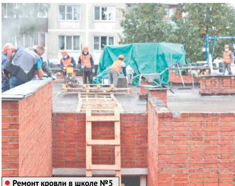
● Ремонт кровли в школе №5

Ремонт кровли пристройки и спортзала МБОУ СОШ 5 также был одним из наиболее долгожданных. Подрядчик проводит демонтаж старого покрытия, выполняет укладку нового утеплителя,