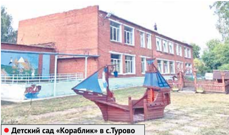
● Детский сад «Кораблик» в с. Турово

дителями, с большим нетерпением ждут преобразования «второго дома». Изменения уже заметны невооруженным глазом. Например, фасад здания приобрел индивидуальные черты: цветовая гамма школы стала светлой