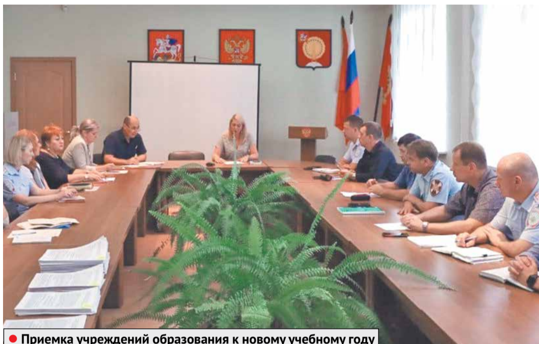
● Приемка учреждений образования к новому учебному году

и теплой, и скоро на ней появится символика в цветах флага России. Современные пластиковые стеклопакеты пришли на смену устаревшим оконным конструкциям.