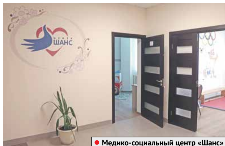
● Медико-социальный центр «Шанс»