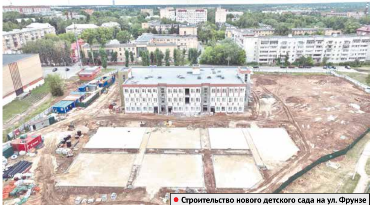
● Строительство нового детского сада на ул. Фрунзе

Новый детский садик является долгожданным событием для жителей всего микрорайона. Здесь проживает много молодых семей – кто-то уже воспитывает детей, другие только планируют. Любому родителю хочется дать своему ребенку все самое лучшее, чтобы он рос в обстановке любви, заботы, внимания, и важно, чтобы такие условия были не только дома, но и там, где закладывается первая ступень в образовании будущего поколения.