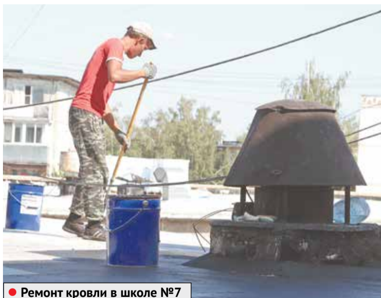
● Ремонт кровли в школе №7

С 15 августа учреждение вернется с летних каникул и начнет работать в полном режиме.