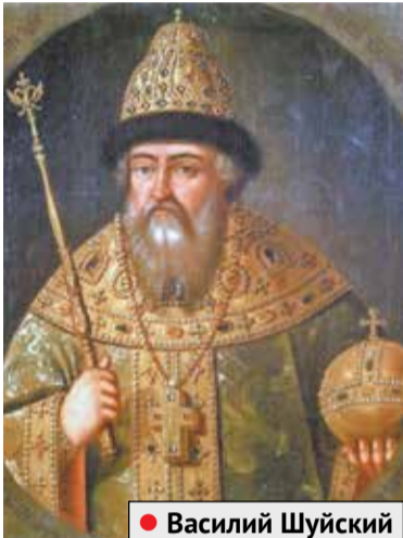
● Василий Шуйский

Что отмечает Россия 4 ноября? День народного единства, ответят все – от мала до велика. Многие думают, что это совсем новый для нашей страны праздник. А между тем с 1649-го по 1917 год он широко отмечался в России, а возрожден в 2009 году. Давайте совершим экскурс в историю.