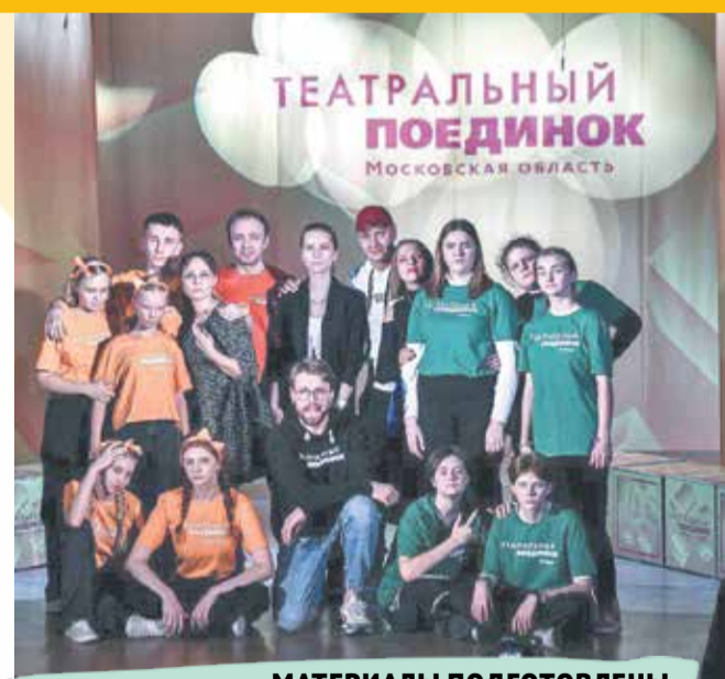
МАТЕРИАЛЫ ПОДГОТОВЛЕНЫ МОЛОДЕЖНЫМ МЕДИАЦЕНТРОМ СЕРПУХОВА

Серпуховичи оказались более убедительными. Теперь им предстоит бороться за место в финале, который пройдет в декабре.