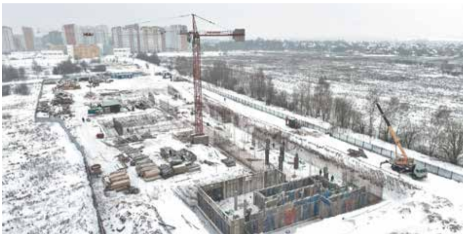
● Строительство новой поликлиники в Ивановских дворах