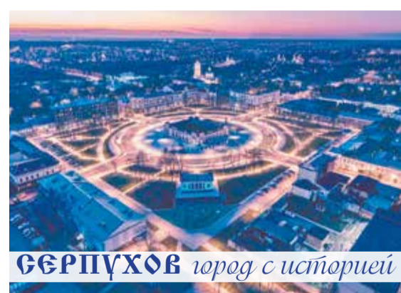
СЕРПУХОВ город с историей

ПРИСОЕДИНЯЙТЕСЬ К ОФИЦИАЛЬНЫМ ГРУППАМ АДМИНИСТРАЦИИ ГОРОДСКОГО ОКРУГА СЕРПУХОВ В СОЦИАЛЬНЫХ СЕТЯХ!