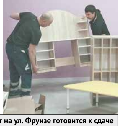
● Детский сад на 250 мест на ул. Фрунзе готовится к сдаче