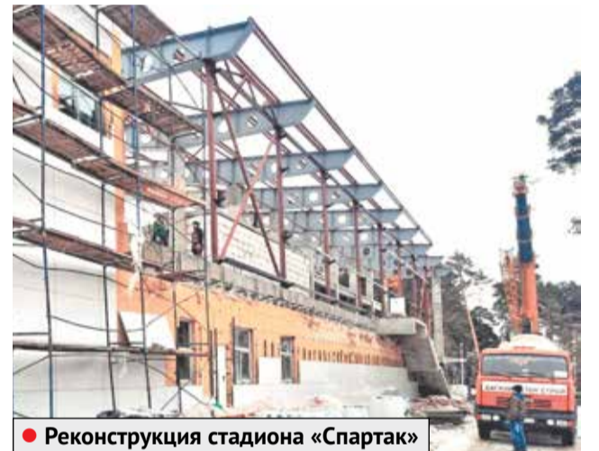
● Реконструкция стадиона «Спартак»