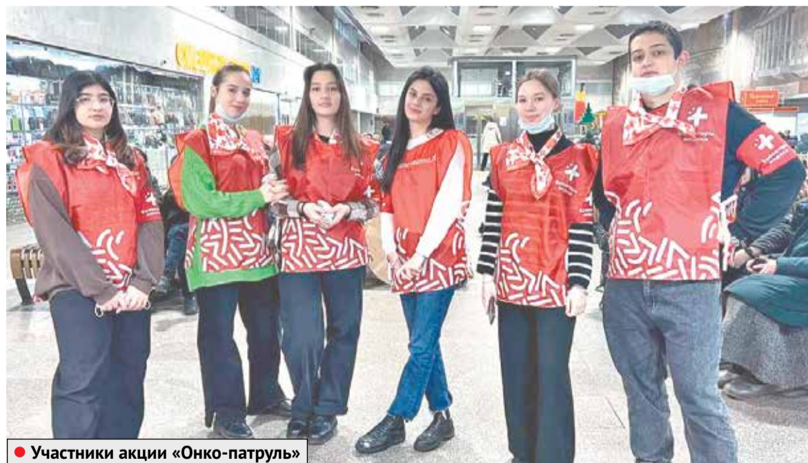
● Участники акции «Онко-патруль»

– Многие считают это пустой тратой времени, но я хочу доказать обратное. Взаимосвязь волонтерской и медицинской деятельности обусловлена спецификой нашей профессии. Знаменитый персидский врач Ар-Рази учил: «...врач обязан быть добрее и внимательнее к больному, нежели отец, мать, друзья и наставник». Один из самых великих врачей средневекового мира Парацельс убеждал: «Сила врача – в его сердце, <...> важнейшая основа лекарства – добрее и внимательнее». Из приведенных изречений ясно, что одним из главных требований и в древности и сейчас к профессиональным компетенциям врача является человечность в отношении к пациенту, а именно – милосердие, доброта, любовь, нравственная чистота, отзывчивость. Все эти черты формируются и реализуются только через практическую деятельность и во многом деятельность, которая не носит принудительного, обязательного характера. Студенческое волонтерство, таким образом, является многоаспектным феноменом и определенным этапом профессионального становления личности медика.