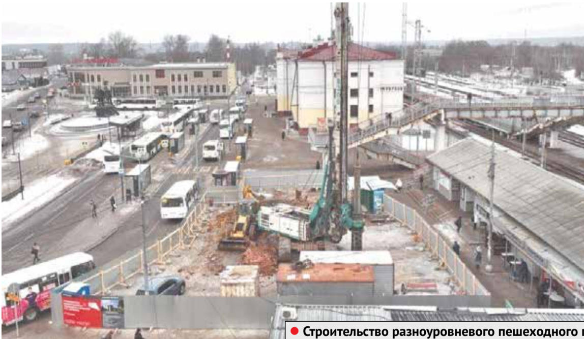
● Строительство разноуровневого пешеходного перехода

После реконструкции стадион станет современным спортивным сооружением, комфортным для зрителей и спортсменов. Футбольное поле заменено на поле с искусственным покрытием и подогревом, будет оборудовано легкоатлетическое ядро с беговыми дорожками, установят новые мачты освещения и информационное табло, будут обновлены трибуны на 2,5 тысячи мест.