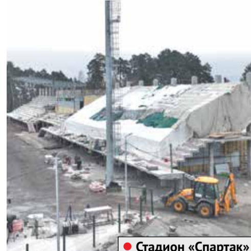
● Стадион «Спартак»