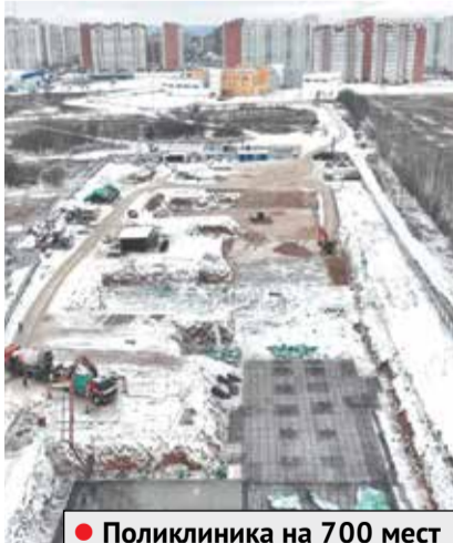
● Поликлиника на 700 мест

– Наказы избирателей – инструмент формирования плана социально-экономического развития муниципалитета и показатель эффективности обратной связи с населением. Соответственно, выполнение наказов – это немалая составляющая успешной работы Совета депутатов и Администрации городского округа. Основным принципом работы с наказами избирателей должна быть прозрачность.