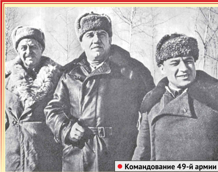
● Командование 49-й армии

Прошло много лет, и я помню, как волновался папа, как вспоминал, где стояла его батарея, которой он, мо-