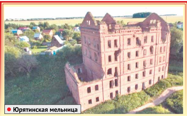
● Юрятинская мельница