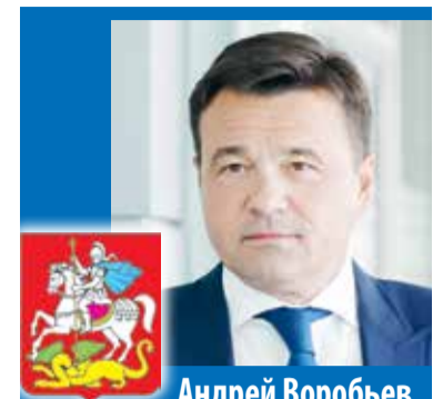
Андрей Воробьев, Губернатор Московской области

– Московская область богата наукоградами – восемь из тринадцати в РФ располагаются в Подмоскovie. Наша задача – говорить на одном языке в плане партнерства и, прежде всего, раскрытия потенциала этих городов. Совершенно очевидно, что технологический суверенитет, научное внедрение – то, что сегодня является главным вызовом.