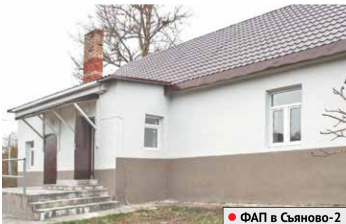
● ФАП в Съяново-2

Комплексные внутренние работы проведены в Туровской участковой больнице: облицованы корпуса амбулатории и терапевтического стационара, обновлены входные ступени и поручни.