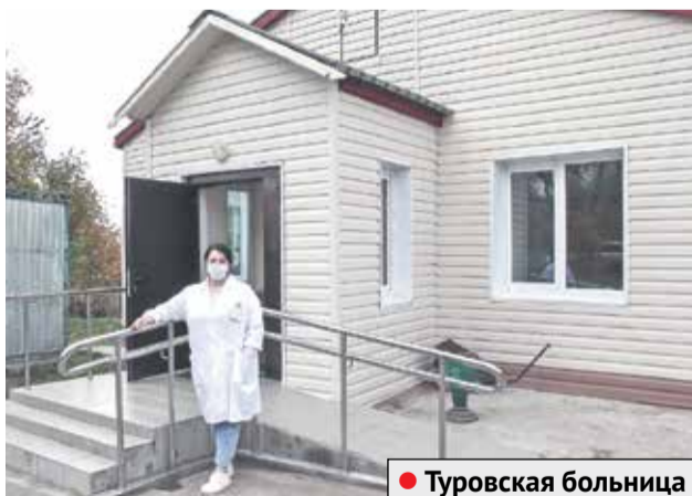
● Туровская больница

На обслуживании у этого ФАПа один из самых больших участков – 9 населенных пунктов, садовые и дачные товарищества. Жители Съянова-2, Вихрова, Лисёнок, Новосёлок, Серпухова-12, Игнатьева, Клейменова, Верхнего и Нижнего Шахлова в шаговой доступности могут получать квалифицированную медицинскую помощь и льготные лекарства: ФАП имеет лицензию на их отпуск. В медучреждении внедряется телемедицина, пользуется большим спросом запись к узким специалистам. Здесь можно пройти первичный осмотр и вакцинацию.