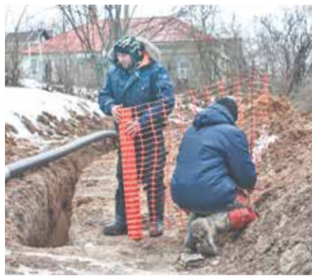
ниципальных округов на момент принятия в концессию находились в крайне изношен-