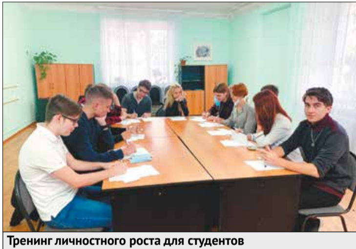
Тренинг личностного роста для студентов