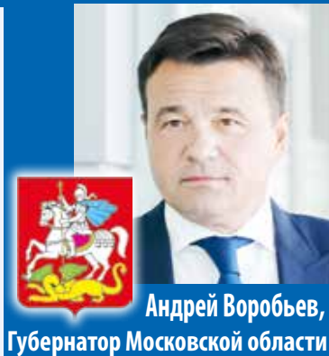
Андрей Воробьев, Губернатор Московской области

– В Подмосковье мы реализуем самую масштабную программу модернизации систем теплоснабжения. В этом году приведем в порядок 425 объектов: котельные, блочно-модульные котельные, центральные тепловые пункты и 258 км теплосетей. Мы продолжаем активную цифровизацию отрасли ЖКХ. Эта работа уже дает результат. В новогодние каникулы число жалоб на аварии сократилось на 14% по сравнению с прошлым годом, несмотря на более холодную погоду. Среднее время устранения сбоев – всего 2 часа. Информацию от всех этих датчиков и диспетчерских ЖКХ-Центр собирает в электронной системе мониторинга «Контур.ЖКХ». При отклонении от нормы – автоматический сигнал и выезд бригады без промедления.