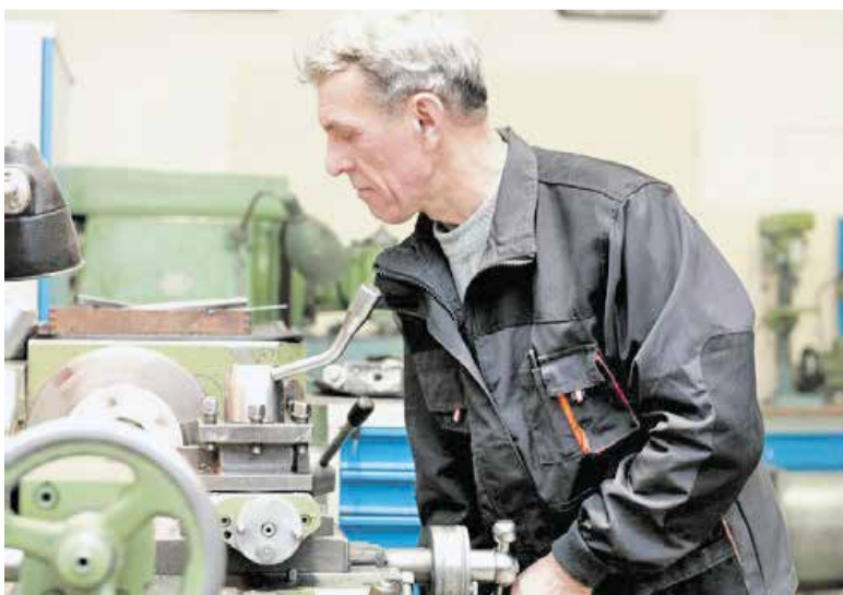
Фото: Научный центр биологических исследований и Институт инженерной физики.

По решению Президента РФ Владимира Путина на территории нашего городского округа создается масштабный научный центр, цель которого – форсировать развитие перспективных отраслей. А статус самого крупного в стране наукограда откроет еще больше возможностей и для науки, и для промышленного производства, и для жителей муниципалитета.