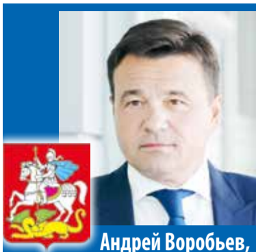
Андрей Воробьев, Губернатор Московской области

– Создание наукограда на территории большого Серпухова является для Подмоскovie знаковым проектом, который позволит аккумулировать и реализовывать самые прорывные, стратегические научные идеи.