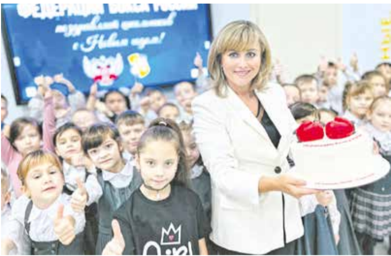
40 тысяч сладких подарков получат юные жители большого Серпухова от Федерации бокса России.

Кто сказал, что о новогодних и рождественских праздниках остались одни воспоминания? Неправда! Длинные выходные дни прошли, а чудеса продолжают.