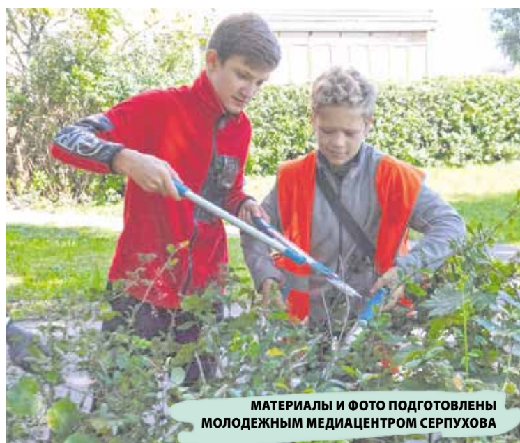
МАТЕРИАЛЫ И ФОТО ПОДГОТОВЛЕНЫ МОЛОДЕЖНЫМ МЕДИАЦЕНТРОМ СЕРПУХОВА