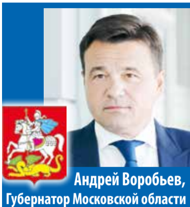
Андрей Воробьев, Губернатор Московской области

– Мы считаем, что комфортными и удобными для жизни должны быть не только новостройки, поэтому реализуем в Подмосковье самую большую по стране программу капремонта жилья. На сегодняшний день реализовано более трети всего объема – мы привели в порядок 17 тысяч МКД, в том числе заменили около 13 тысяч лифтов.