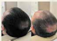
Промежуточный результат восстановления луковиц волос

Адрес: г.о. Серпухов, ул. 2-я Московская, д. 6, к. 5 Телефоны: +7 (963) 665 53 33 +7 (4967) 12 81 12