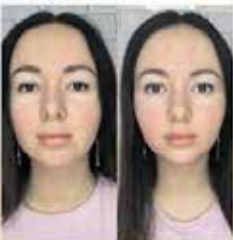
Результат Эндосферы лица