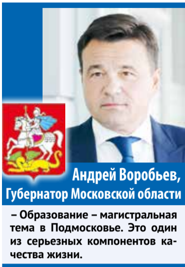
Андрей Воробьев, Губернатор Московской области

– Образование – магистральная тема в Подмоскowie. Это один из серьезных компонентов качества жизни.