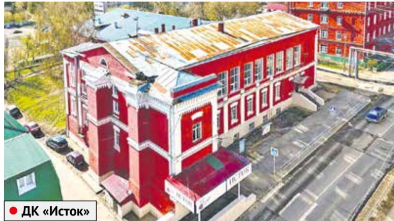
● ДК «Исток»

Теперь «Радуга» соответствует современным стандартам.