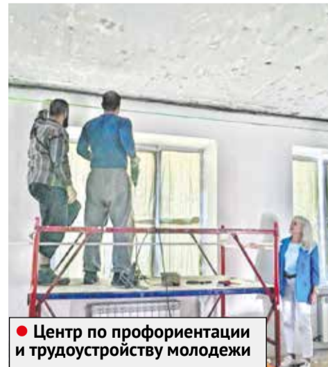
● Центр по профориентации и трудоустройству молодежи