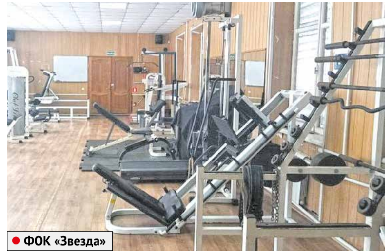
● ФОК «Звезда»

шой объем кровельных работ. Это необходимо для защиты дошкольных учреждений от протечек. В детском саду №47 «Радуга» ремонт кровли завершен. В детских садах «Матрешка» и «Росинка» демонтировано старое покрытие. Благоприятные погодные условия на стороне подрядчика. Отставания от графика нет.