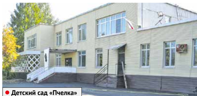
● Детский сад «Пчелка»