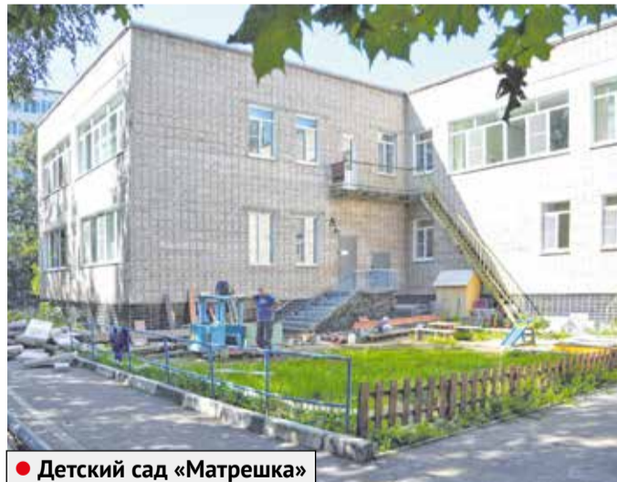
● Детский сад «Матрешка»