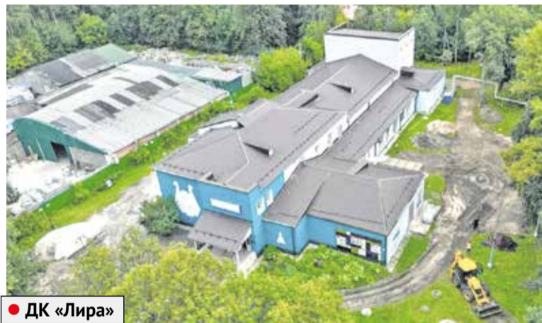
● ДК «Лиры»

удастся выполнить в полном объеме, и жители села Липицы и близлежащих населенных пунктов оценят произошедшие изменения.