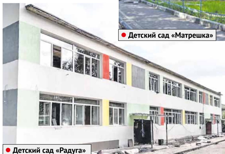
● Детский сад «Радуга»