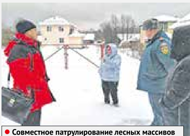
● Совместное патрулирование лесных массивов

В Серпухове каждый пожароопасный период строго контролируется.