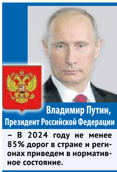
Владимир Путин, Президент Российской Федерации

– В 2024 году не менее 85% дорог в стране и регионах приведем в нормативное состояние.