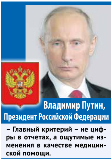
Владимир Путин, Президент Российской Федерации

– Главный критерий – не цифры в отчетах, а ощутимые изменения в качестве медицинской помощи.