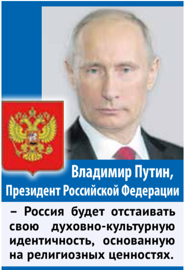
Владимир Путин, Президент Российской Федерации

– Россия будет отстаивать свою духовно-культурную идентичность, основанную на религиозных ценностях.