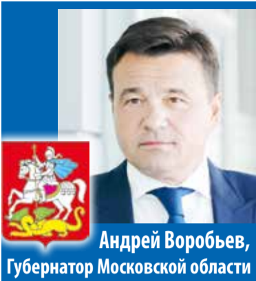
Андрей Воробьев, Губернатор Московской области

– В регионе – самый мощный снегопад за последние 40 лет. Всю ночь дороги и улицы чистили почти 3 тысячи человек, больше 2 тысяч единиц техники. Работы не останавливаются ни на минуту. Особое внимание – маршрутам общественного транспорта.