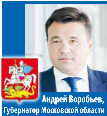
Андрей Воробьев, Губернатор Московской области

Накануне Дня Матери сразу несколько многодетных семей Подмосковья получили награды от Губернатора Московской области Андрея Воробьева. Среди них – жители Большого Серпухова.