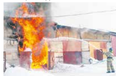
Фото- и видеофиксация

В случае обнаружения возгорания немедленно сообщайте о нём по единому номеру 112.