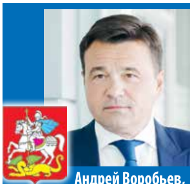
Андрей Воробьев, Губернатор Московской области

Московская область – регион спортивный. И развитие спортивной инфраструктуры – по-прежнему одно из важных направлений для Подмосковья. В регионе регулярно проходят мероприятия с участием звезд спорта, они всегда привлекают много молодых людей.