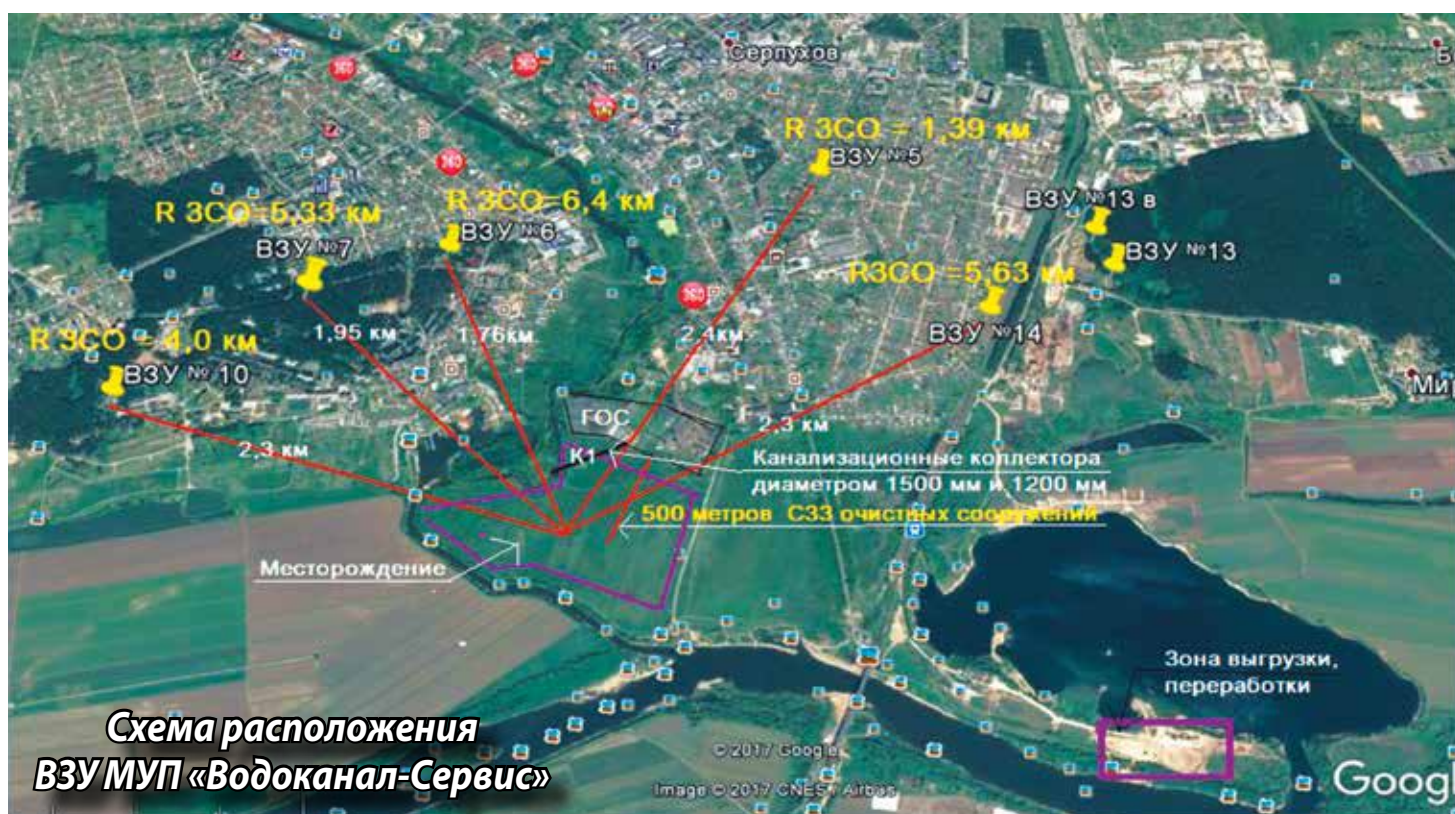
Схема расположения ВЗУ МУП «Водоканал-Сервис»

Поскольку впадающая в Оку река Нара имеет мягкий песочный берег, который в настоящее время постепенно осыпается, то взрывы и рабо-