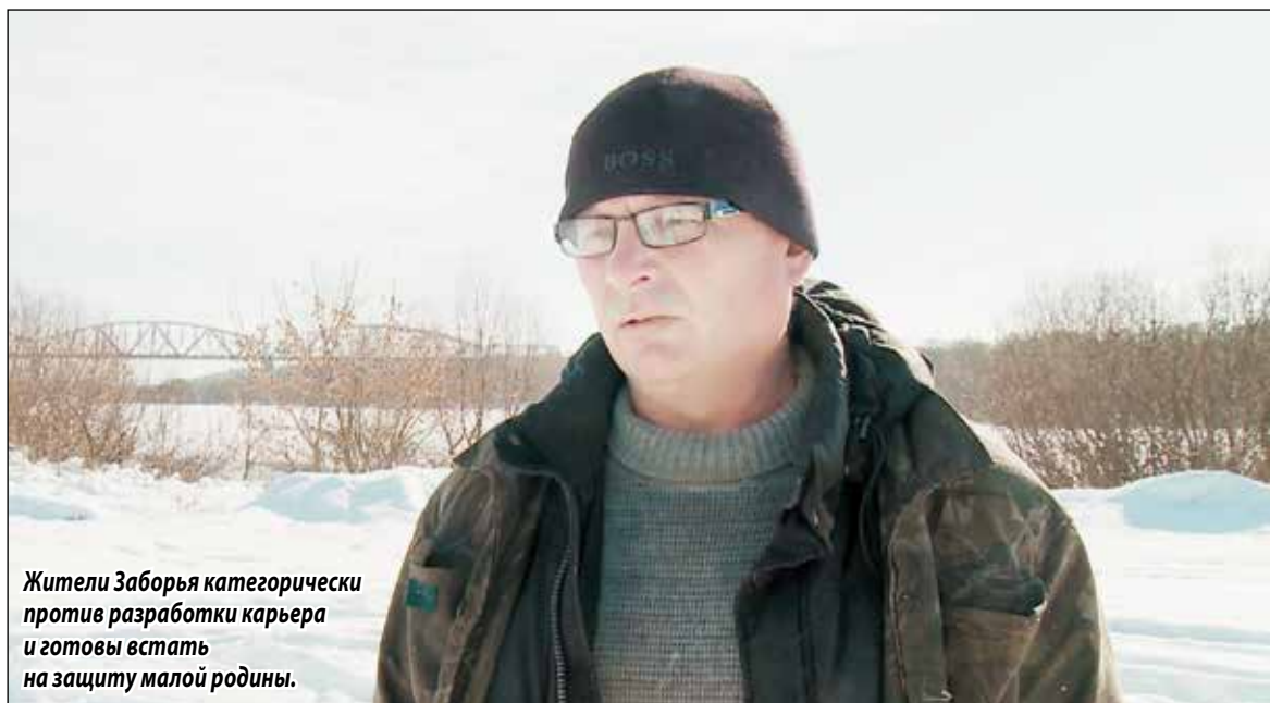
Жители Заборья категорически против разработки карьера и готовы встать на защиту малой родины.

Вооружившись этим сомнительным «kozyрем», потенциальные добытчики нерудных ископаемых подались в Министерство экологии и природопользования Московской области подавать заявление о разработке недр. Было это, напомним, в 2014 году. Правда, сходу не получилось: эксперты, которых привлекло