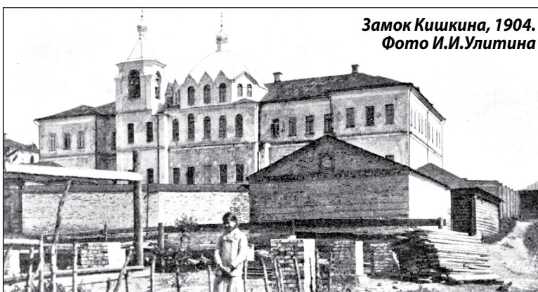
Замок Кишкина, 1904.

При наборе в армию рекруты обязательно проходили медицинский осмотр на сборном пункте. Годные по здоровью принятые рекруты в этот же день приводились к присяге и пере-