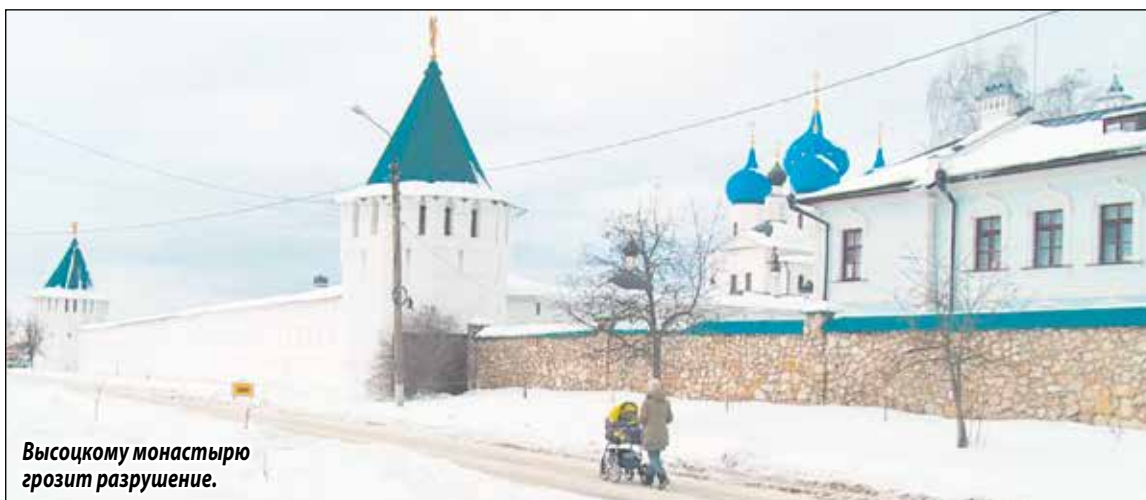
Высоцкому монастырю грозит разрушение.

Однако шум в средствах массовой информации был поднят давно и никак не утихнет. Поэтому спикер радиоэфира решил погрузиться в подробности... И дальше высказался в том смысле, что разработка «всего» 20 га рядом с городскими очистными сооружениями, на поле общей площадью в 200 гектаров «никаких проблем не создаст». Дескать, это всё страшилки, выдумки тех, кто «боится, что Серпуховский район что-то лишнее заработает», лучше думайте о городских очистных,